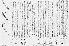
1565, octubre, 19. Madrid Capítulos de los Fueros concedidos por los Reyes Católicos a Vera en 1494.